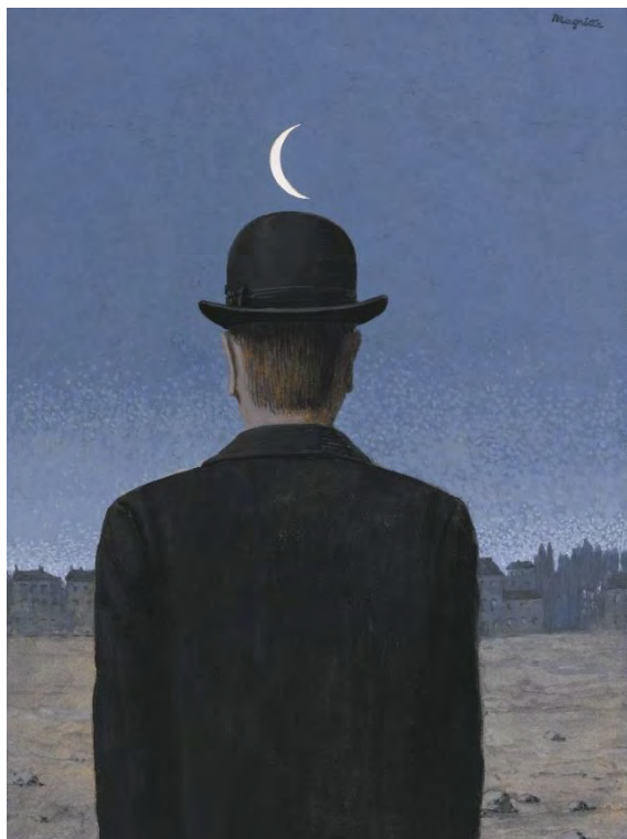
René Magritte, Il maestro di scuola , 1955