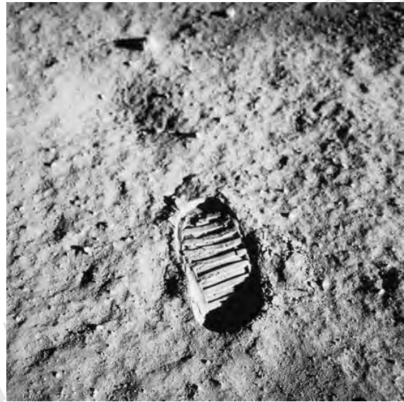
Buzz Aldrin nella foto scattata da Neil Armstrong il 20/07/1969 e la prima impronta umana sul suolo lunare.

Quest'anno si celebra l'anniversario dello sbarco sulla Luna della Missione NASA Apollo 11, avvenuto il 20 luglio del 1969.