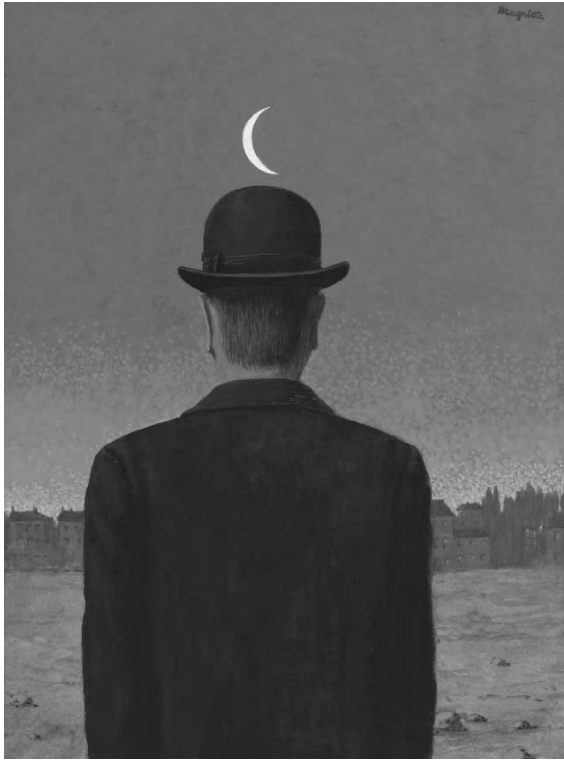
René Magritte, Il maestro di scuola , 1955