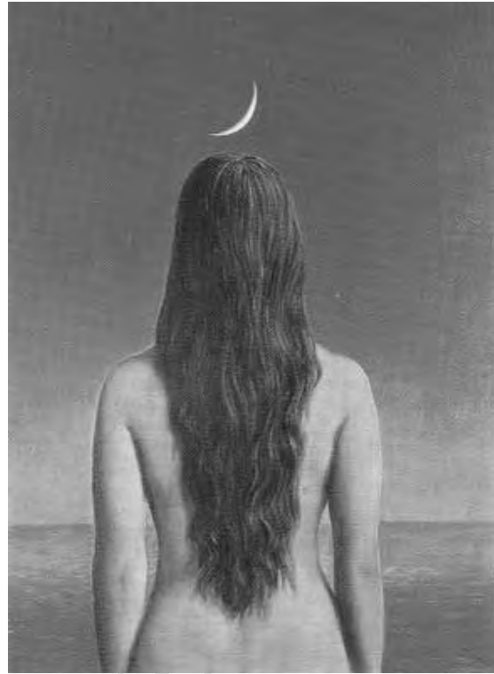
René Magritte, L'abito da sera , 1954

L'uomo ha spesso espresso il desiderio di raggiungere la luna, ma ogni volta che egli pensa di “averla tra le mani”, di averne svelato il mistero, in realtà si accorge che non la possiede affatto; e così torna a rappresentarla per poterla ammirare, celebrare, possedere.