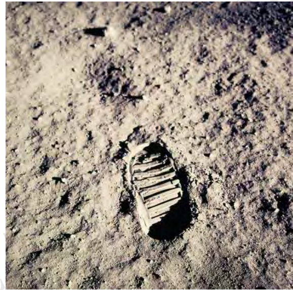
Buzz Aldrin nella foto scattata da Neil Armstrong il 20/07/1969 e la prima impronta umana sul suolo lunare.

Quest'anno si celebra l'anniversario dello sbarco sulla Luna della Missione NASA Apollo 11, avvenuto il 20 luglio del 1969.