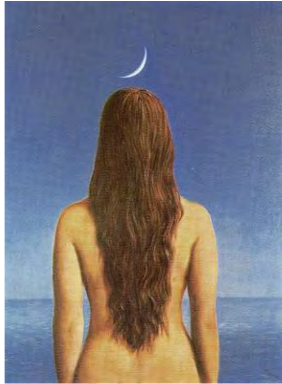
René Magritte, L'abito da sera , 1954

L'uomo ha spesso espresso il desiderio di raggiungere la luna, ma ogni volta che egli pensa di “averla tra le mani”, di averne svelato il mistero, in realtà si accorge che non la possiede affatto; e così torna a rappresentarla per poterla ammirare, celebrare, possedere.