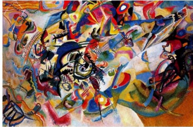
Vassily Kandinsky, 1913 - Composition VII