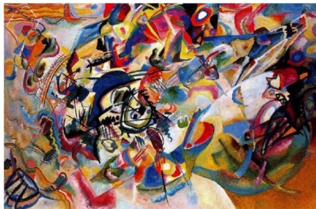
Vassily Kandinsky, 1913 - Composition VII