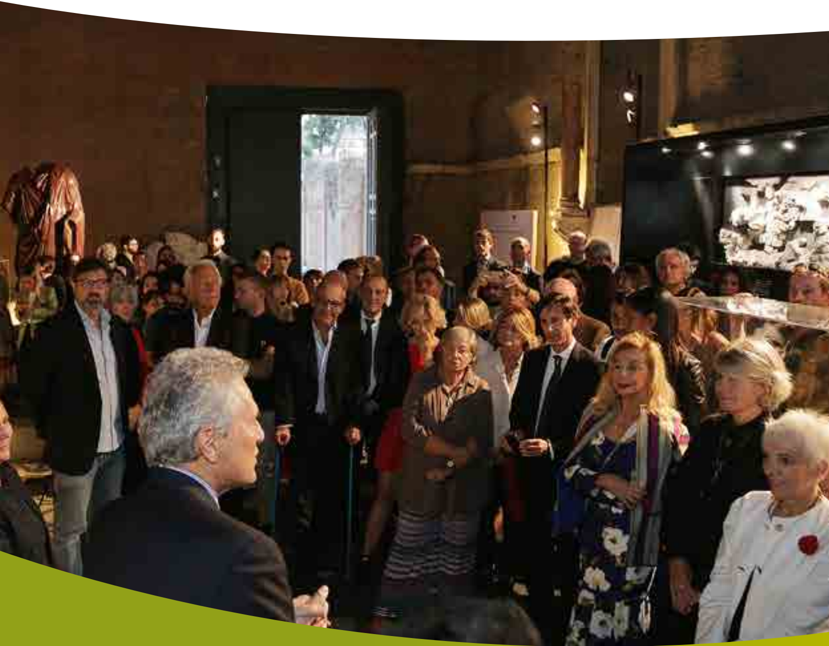
▶ Inaugurazione Mostra "Persona. Aeffetti Speciali", Curia Iulia - Parco Archeologico del Colosseo