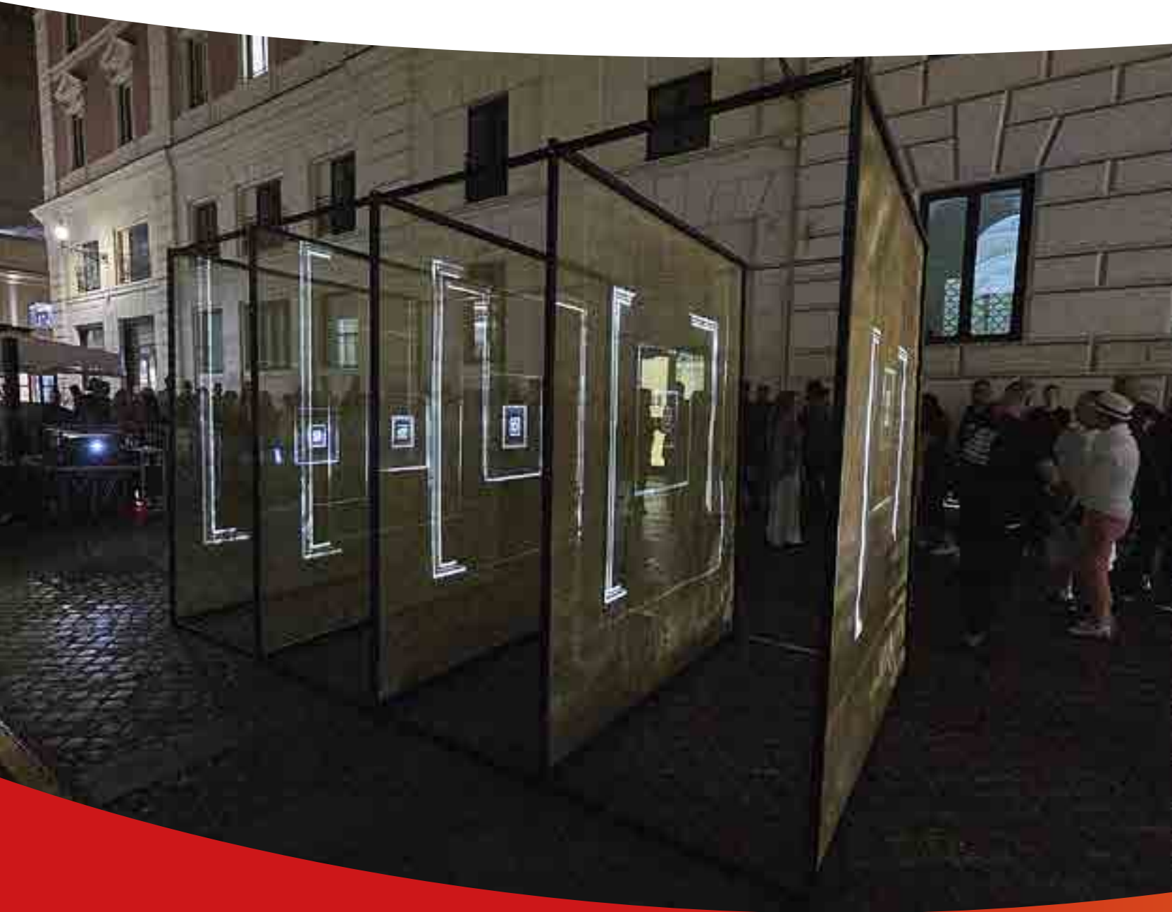
▶ Progetto site specific a via delle Muratte, Intesa Sanpaolo Main Partner Videocittà