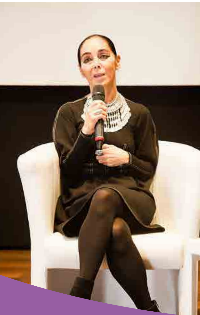
▶ Shirin Neshat durante l'incontro pubblico al Maxxi