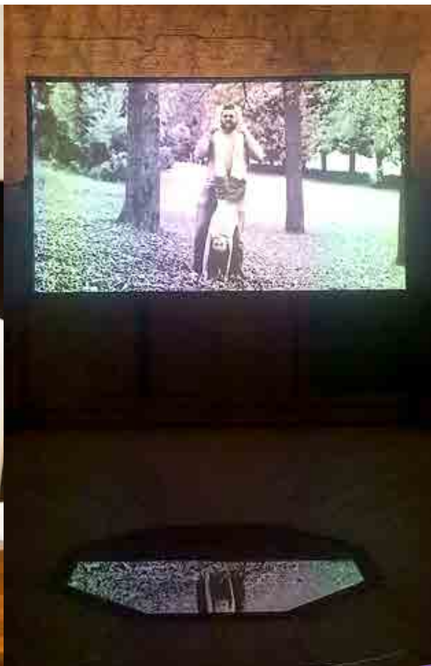
▶ Ex Planetario delle Terme di Diocleziano, uno dei video della rassegna Magic Lantern Film Festival