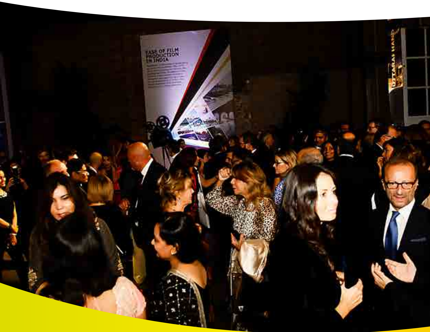
▶ Padiglione India, serata inaugurale